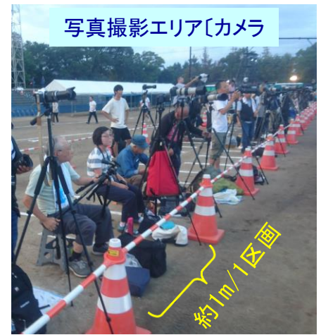
写真撮影エリア[カメラ]