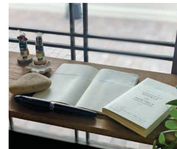
自社販売している、イレコ手帳。月間欄と週間欄が同時に見ることができるページ構成。