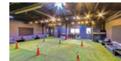
左下)約100畳の室内練習場 右下)Facebook