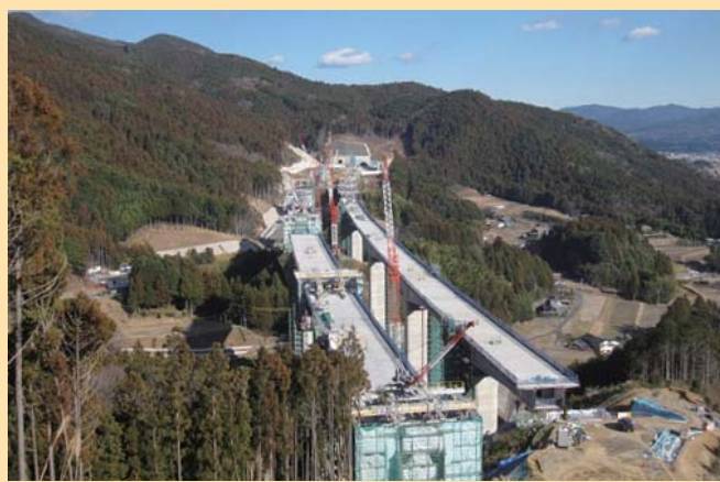
建設が進む新東名高速道路

市内では現在、平成27年の早い時期の供用開始に向けて新東名高速道路の建設が進められています。新城市では新城インターチェンジ（仮称）周辺の道路整備や奥三河地域の雇用の場の確保のため企業用地の開発計画と奥三河の観光ハブステーションとなる道の駅の建設計画を進めています。